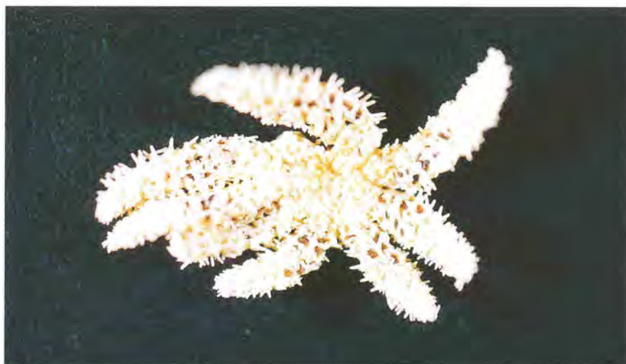
Fig. 2 Specimen of a sea star, Coscinasterias acutispina , collected from Okinawa Island in December, 1997.

Notice the presence of long and short arms, indicating the occurrence of fission (asexual reproduction).