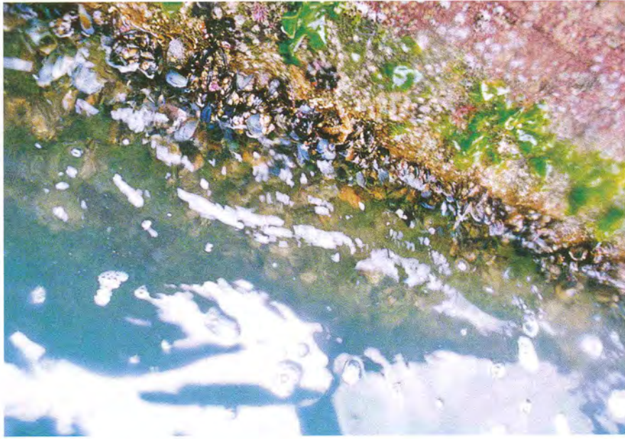
Fig. 3 Photograph showing the appearance of a sea star, Coscinasterias acutispina , just above an intertidal mussel bed at the offshore breakwater of Himi Fishing Port, Toyama Bay.