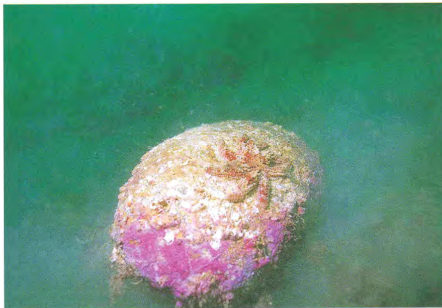
Fig. 4 Photograph of Coscinasterias acutispina found at the undersurface of overlapping boulders at a depth of 20m off Kinone, Nyuzen, Toyama Bay.