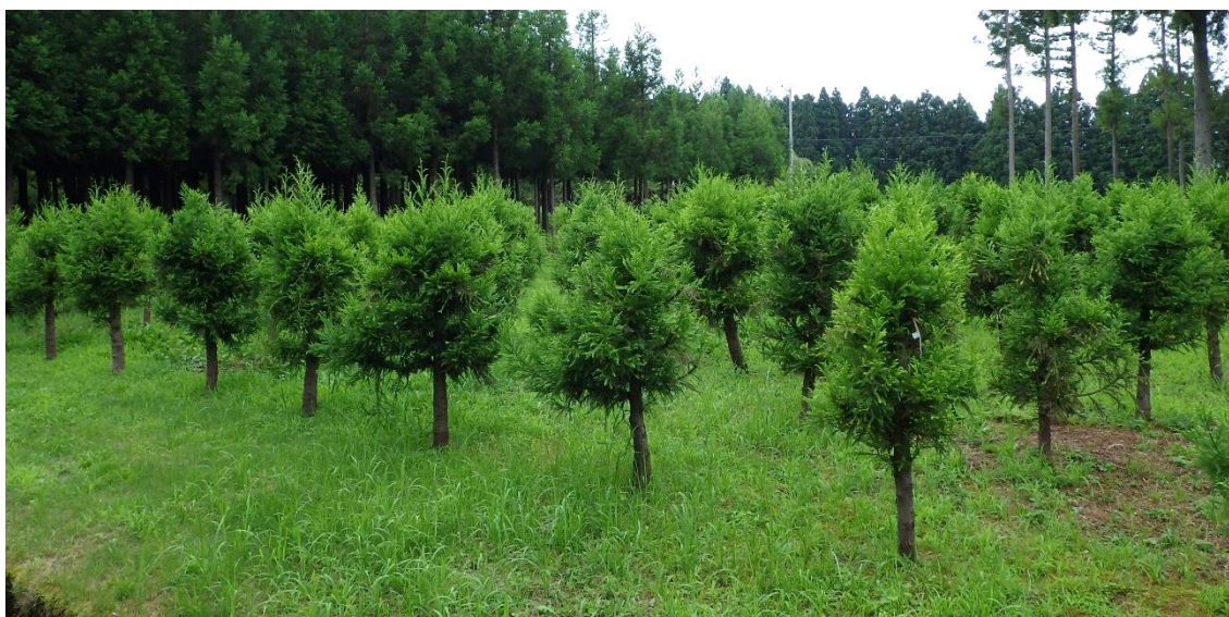
図-1 「立山 森の輝き」の採穂園 (県森林研究所の構内) 「立山 森の輝き」の優良個体を 2m間隔で植栽. 樹高は 1.5~1.8 m

さし木苗の生産にあたっては、まず大量のさし穂を採取することが重要になります。そのためには、集約的な取り扱いが可能で、効率的にさし穂を採取するための「採穂園」(図-1)を造成する必要があります。