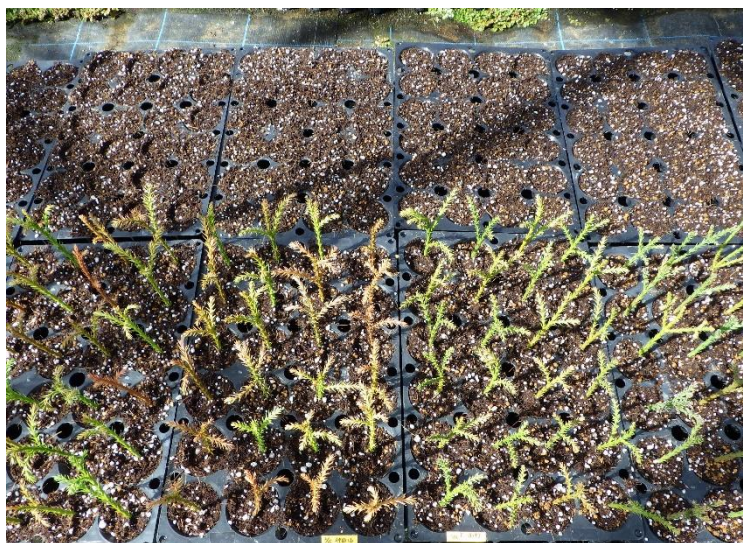
図-13 マルチキャビティコンテナに直挿した さし穂

多くの苗は、翌年の秋に出荷可能な大きさになりますが、同じコンテナ内でも成長差が出てくる場合があります。