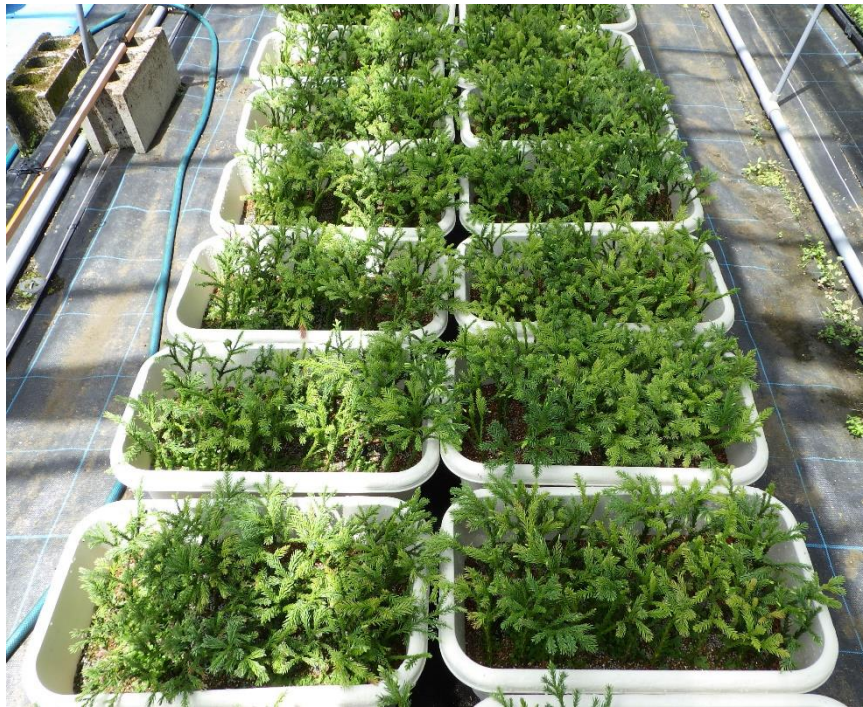
図-9 プランターに挿しつけした苗