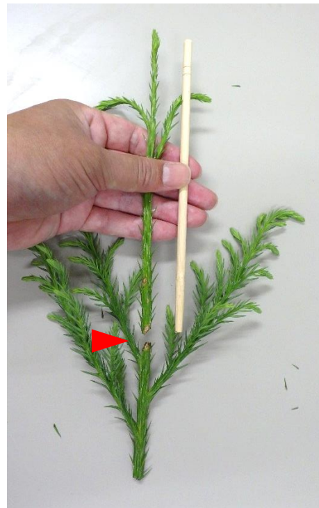
図-4 荒穂の簡便な切断方法