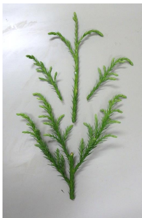
図-6 穂作りしたさし穂