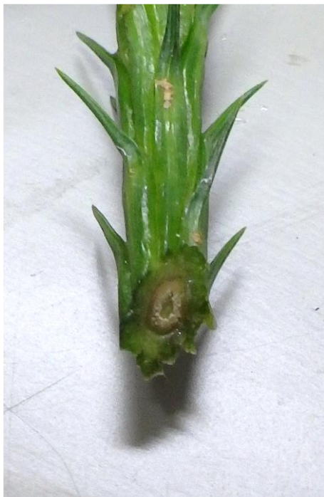
図-5 斜め切りしたさし穂の基部