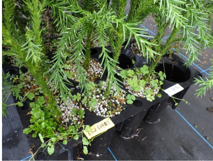
図-14 ハイコントロール 085 の追肥