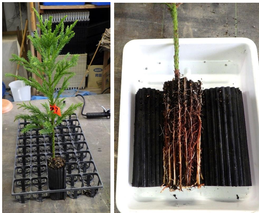
図-12 2年生のコンテナさし木苗(令和2年10月) 苗高が約45cmで根系も充実している。