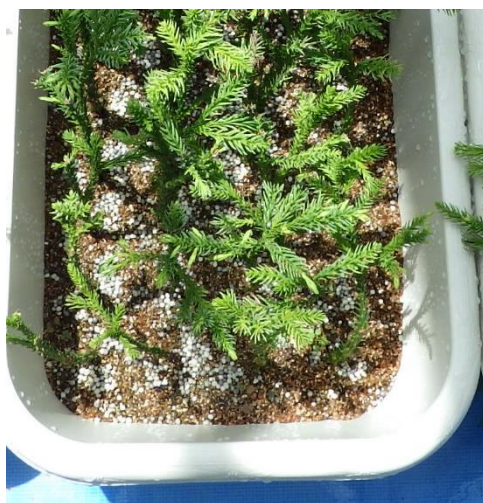
図-10 ハイコントロール 085 を散布したさし木苗 (ハイコントロール 085 は直径 4mm 程度の白色の粒形)

挿しつけから 2 ヶ月程で発根し始めますので、その後は成長に必要な肥料を与える必要があります。バーミキュライトには肥料分が含まれておりませんが、使用する肥料には 3 大栄養素である窒素・リン酸・カリに加えてマグネシウムや鉄、マンガンなど微量元素も必要になります。そのため、県森林研究所では複合型の緩効性肥料であるハイコントロール 085（ジェイカムアグリ）180 日タイプをしています。散布方法は 5 月下旬から 6 月上旬にかけて培土 1L あたり約 5g の肥料を培土の上に撒くだけで大丈夫です（図-10）。培土に埋め込む必要はありません。