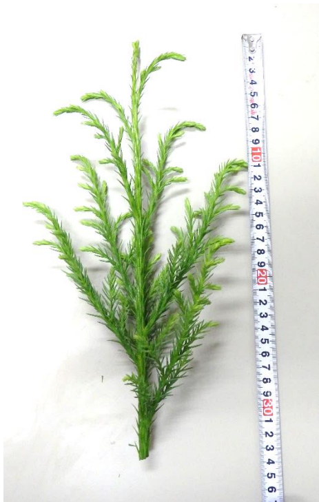
図-3 台木から採取した荒穂