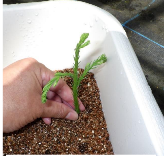
図-8 挿しつけの方法