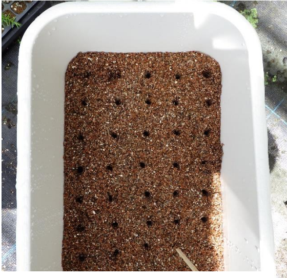
図-7 割箸による挿しつけ穴