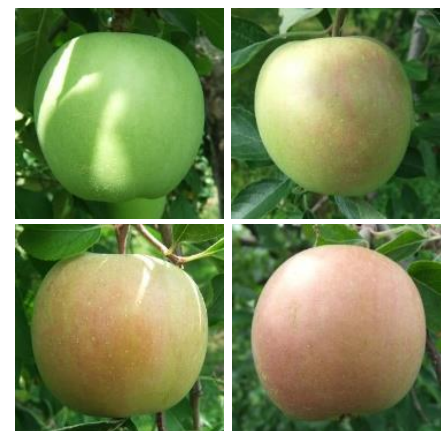
図1 仕上げ摘果時の着色区分 左上:着色なし(着色面積0%)、右上:着色少(同0～5%)、左下:着色中(同5～10%)、右下:着色多(同10%以上)