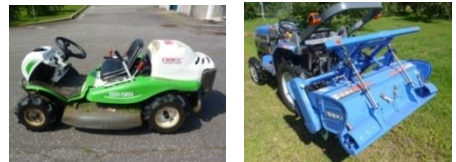
図1 落葉処理に利用した作業機械

※10aあたり作業時間には、各処理前に刈払い機による除草兼落葉かき出し作業(60分/10a)を含む。また粉碎2回、3回には、2回目以降の処理前に、幹元からの落葉かき出し作業(20分/10a・回)を含む。