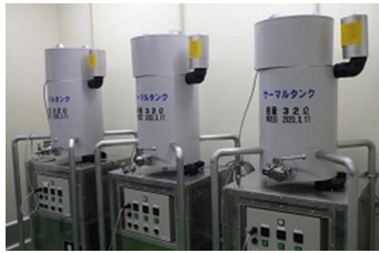
温調仕込みタンク