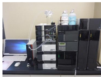
液体クロマトグラフ