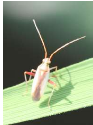
写真: アカスジカスミカメ成虫

問合せ先 農業研究所 病理昆虫課 TEL076-429-5249 FAX076-429-2701